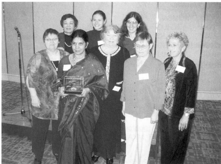
Die YLs beim Gala-Abend